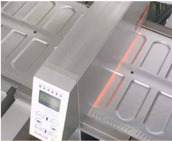
Kamerakontrolle der tiefgezogenen Blister auf Risse