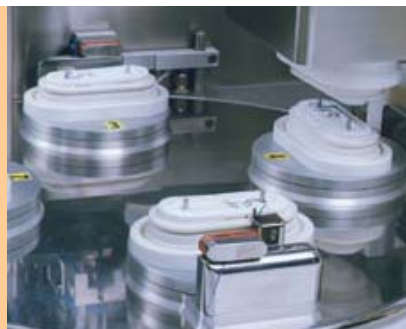
Aufwickeln des Nahtmaterials auf den Träger